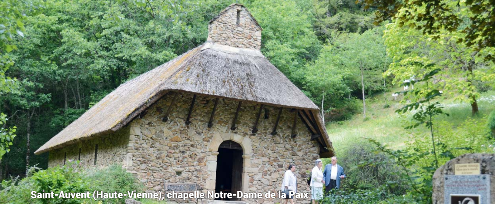
Saint-Auvent (Haute-Vienne), chapelle Notre-Dame de la Paix