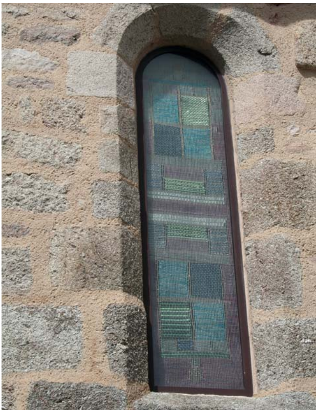
Domeyrot (Creuse), vitrail-tapisserie