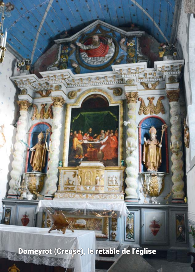
Domeyrot (Creuse), le retable de l'église