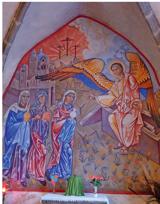
Auzances (Creuse), fresque de Greschny

14 h – Berneuil : église Saint-Cessateur. Les trois autels baroques,