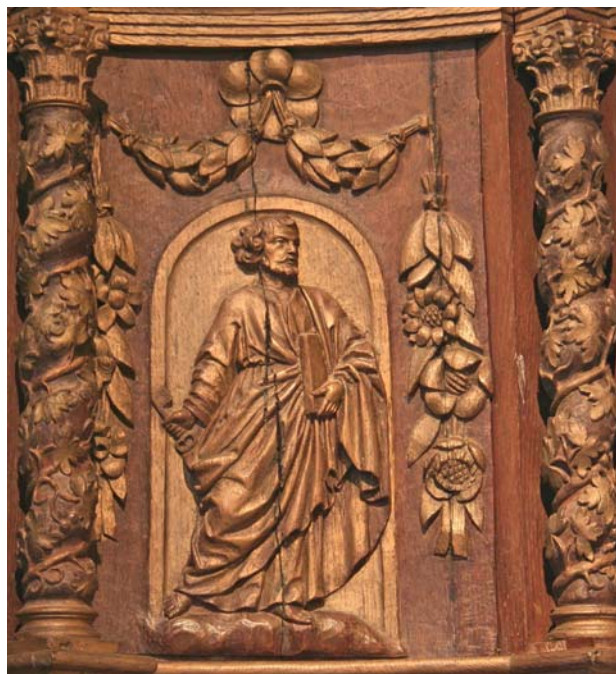
Saint-Barbant (Haute-Vienne) autel baroque

Accueil dans la collégiale Saint-Pierre-ès-Liens, édifice roman du XII e siècle, et visite de la crypte, du trésor, et vue sur le chevet. En