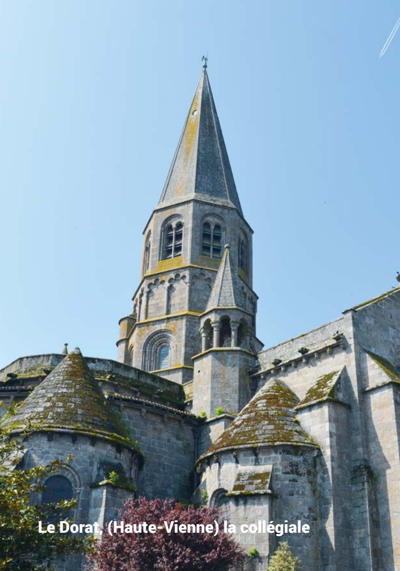
Le Dorat, (Haute-Vienne) la collégiale